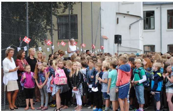
Første skoledag for 1. til 10. klasse. Alle elever samles i skolegården