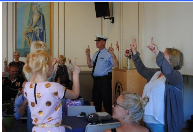
Første skoledag for 0. klasse. Elever og forældre samles i Valdemarsalen